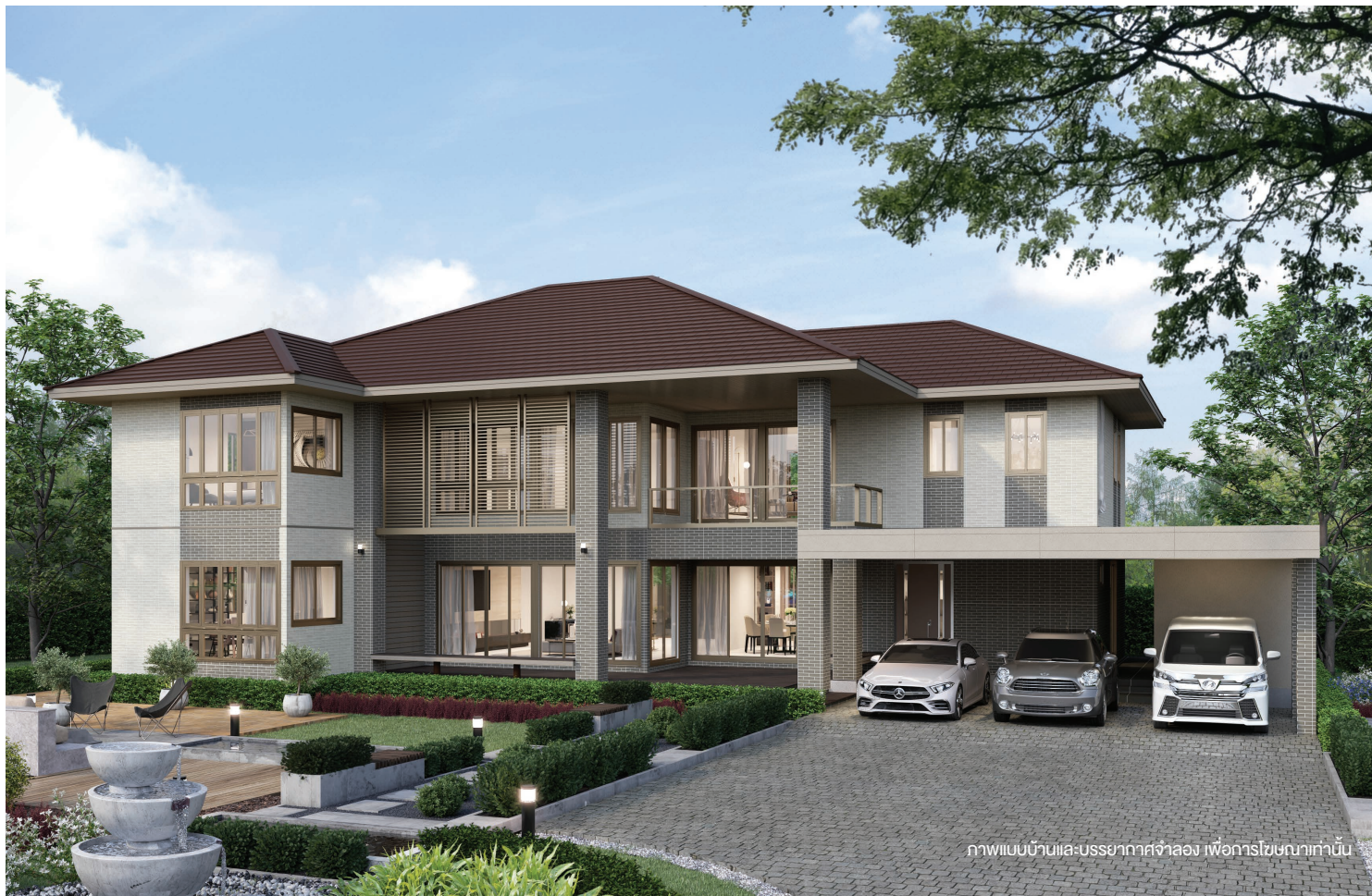
ภาพแบบบ้านและบรรยากาศจำลอง เพื่อการโฆษณาเท่านั้น

บ้าน 2 ชั้น สไตล์ Signature สำหรับครอบครัวขนาดกลางถึงขนาดใหญ่ ที่ต้องการพื้นที่ใช้สอยมากขึ้น ออกแบบโดยเลือกใช้ระแนง Façade อลูมิเนียม ตกแต่งภายนอก โถงกลางภายในบ้านเปิดโล่ง ให้ความรู้สึกโปร่งสบาย โดดเด่นด้วยการจัดพื้นที่ส่วนกลางแบบ Open-plan เชื่อมต่อกัน พร้อมทั้งเชื่อมกับชานนั่งเล่นหน้าบ้านให้เป็นพื้นที่ที่ทุกคนในบ้านมาใช้เวลาร่วมกันได้ ห้องนอนออกแบบให้เป็นสัดส่วน โดยเฉพาะห้องนอนใหญ่ มีความพิเศษด้วยโซนแต่งตัวและห้องน้ำขนาดใหญ่ พร้อมทั้งระเบียงนั่งเล่นขนาดใหญ่