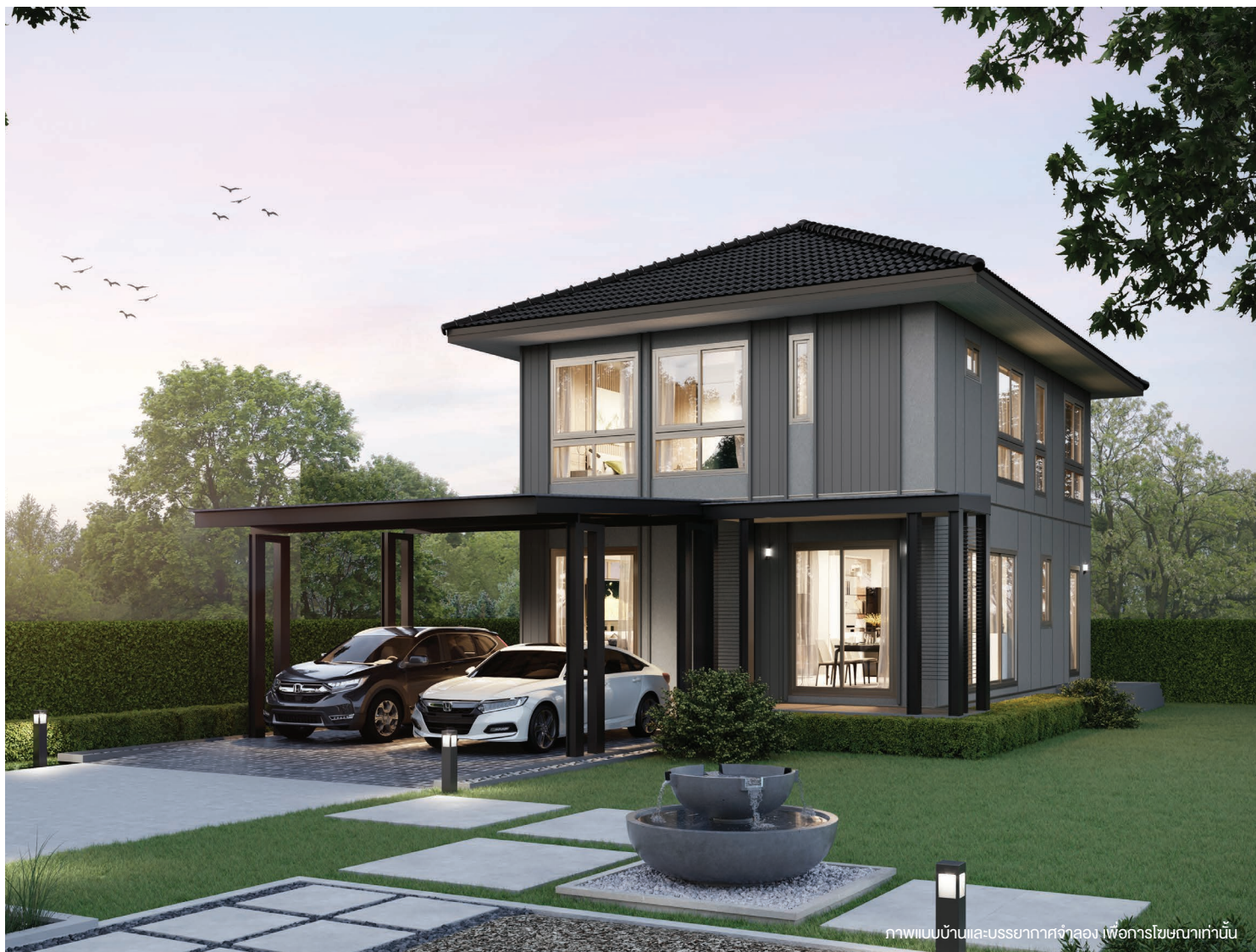
ภาพแบบบ้านและบรรยากาศจำลอง เพื่อการโฆษณาเท่านั้น

บ้านสองชั้นสไตล์ Modern ออกแบบมาเพื่อที่ดินหน้าแคบ แต่พื้นที่ภายในถูกแบ่งสัดส่วนเพื่อผู้อยู่อาศัยได้อย่างลงตัว เหมาะกับครอบครัวที่ต้องการเริ่มต้นชีวิตใหม่ในพื้นที่จำกัด