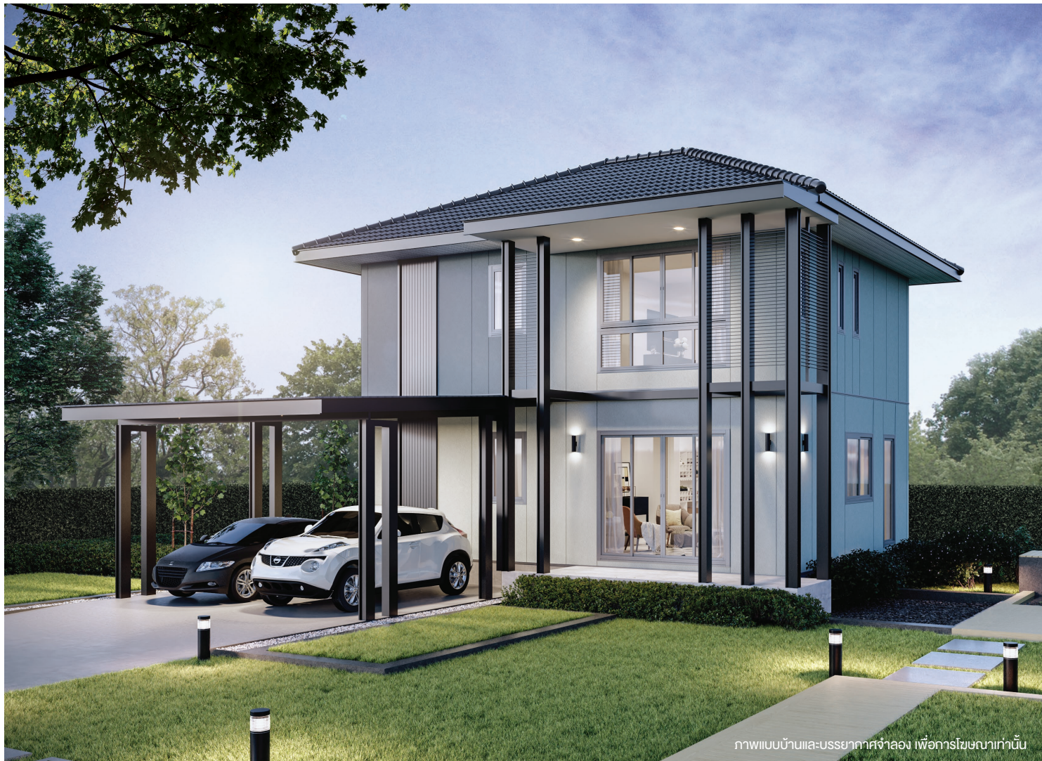
ภาพแบบบ้านและบรรยากาศจำลอง เพื่อการโฆษณาเท่านั้น

โดดเด่นด้วยการจัดฟังก์ชันอย่างต่อเนื่องแต่เป็นสัดส่วนเพื่อรองรับทุกกิจกรรมของครอบครัว ชั้นล่างมีห้องนอนที่ออกแบบเพื่อรองรับการใช้งานของผู้สูงอายุ ภายนอกตกแต่งสไตล์โมเดิร์น เหมาะสำหรับครอบครัวที่มีสมาชิกทุกช่วงวัย