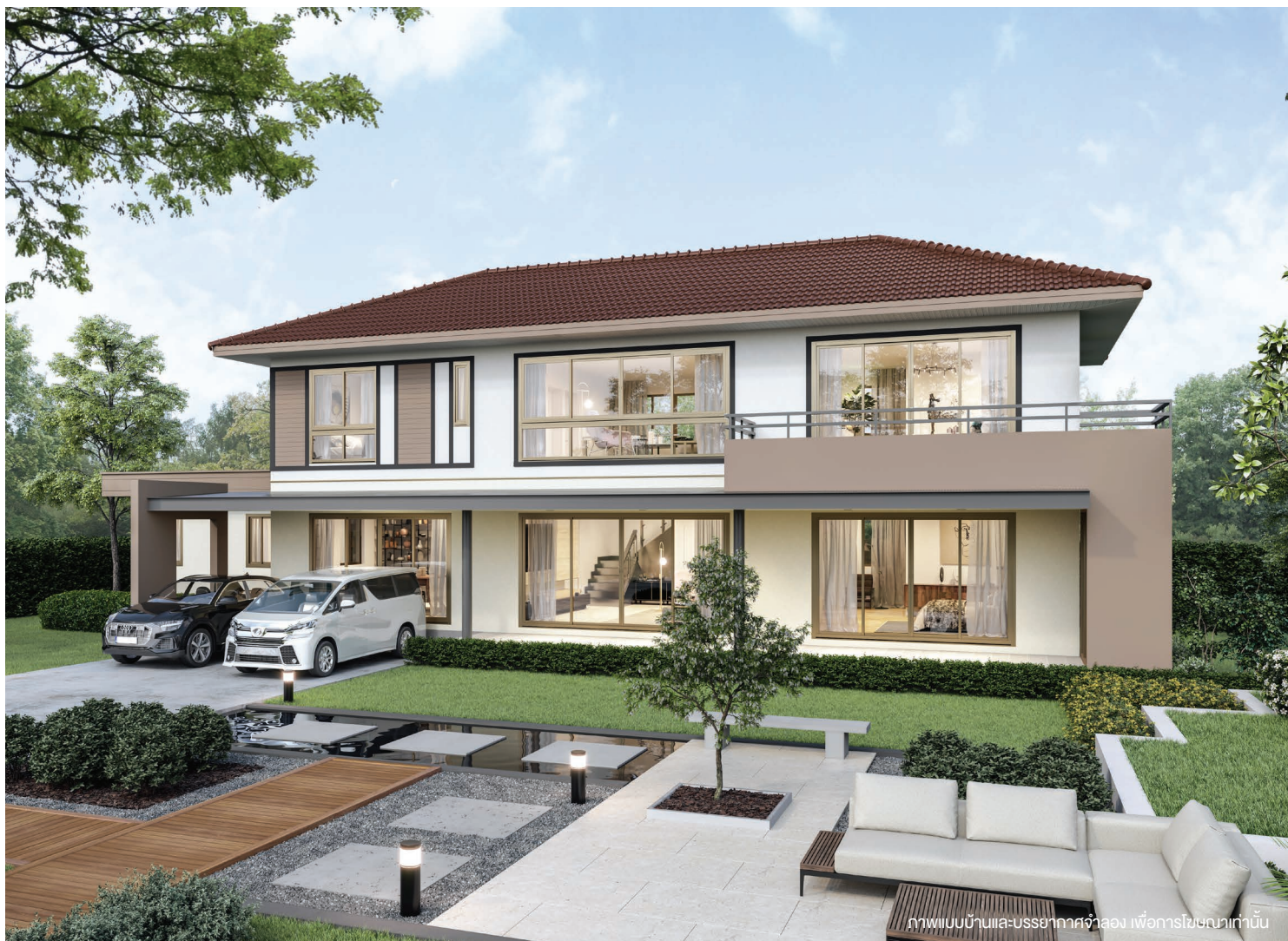
ภาพแบบบ้านและบรรยากาศจำลอง เพื่อการโฆษณาเท่านั้น

บ้าน 2 ชั้นสไตล์ Contemporary เหมาะสำหรับครอบครัวขนาดกลาง ที่ต้องการพื้นที่ใช้สอยมากขึ้น ภายนอกตกแต่งให้ดูเรียบง่ายแต่ทันสมัย ภายในแบ่งการใช้งานเป็นสัดส่วนอย่างลงตัว ชั้นล่างมีห้องนอนรองรับการใช้งานของผู้สูงอายุ