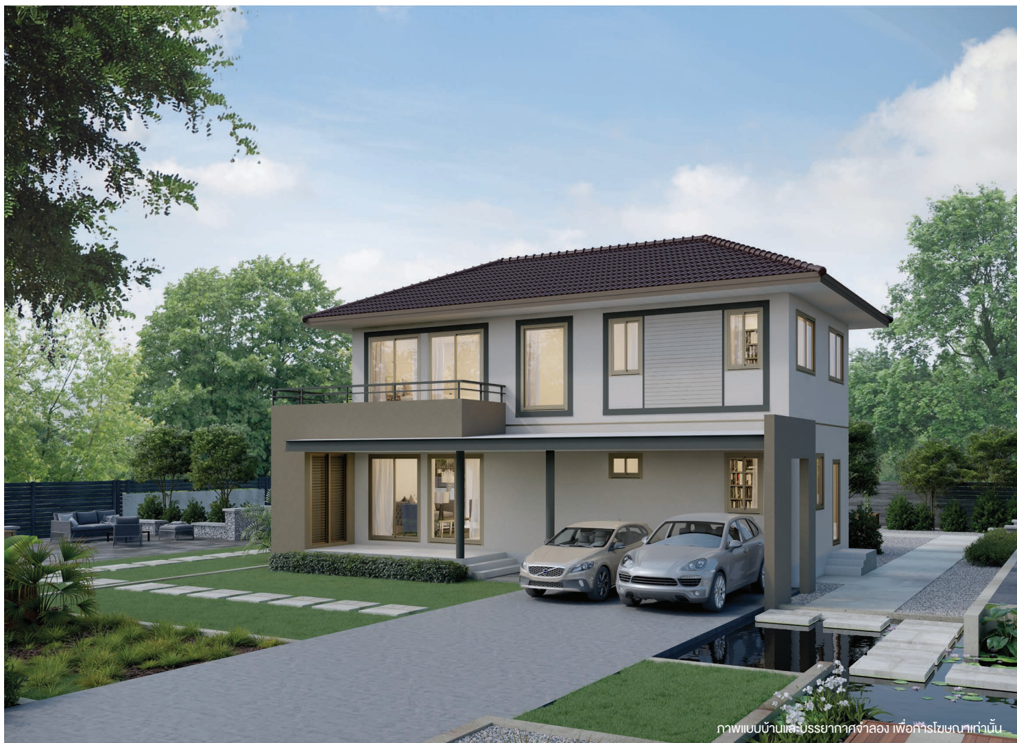
ภาพแบบบ้านและบรรยากาศจำลอง เพื่อการโฆษณาเท่านั้น

3 ห้องนอน 3 ห้องน้ำ ห้องรับแขก ห้องรับประทานอาหาร ห้องครัวไทย ห้องเตรียมอาหาร และส่วนซักรีด