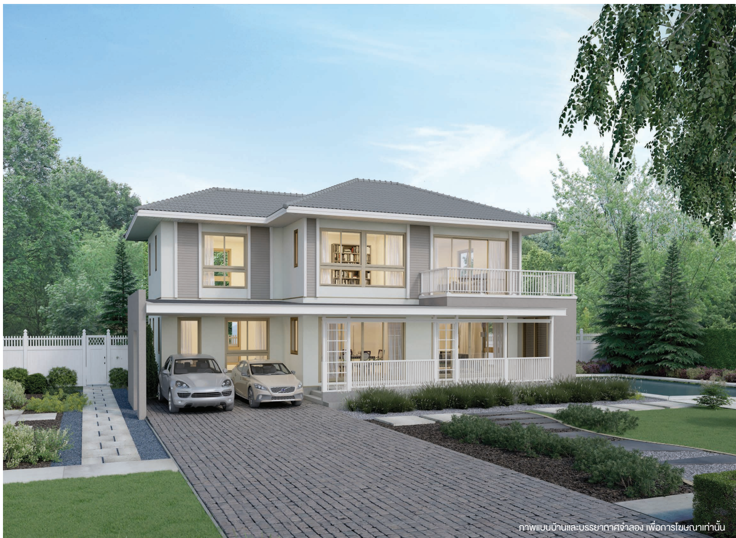
ภาพแบบบ้านและบรรยากาศจำลอง เพื่อการโฆษณาเท่านั้น

3 ห้องนอน 3 ห้องน้ำ ห้องรับแขก ห้องรับประทานอาหาร ห้องครัวไทย ห้องเตรียมอาหาร ห้องสำหรับทำกิจกรรมในครอบครัว และส่วนซักรีด