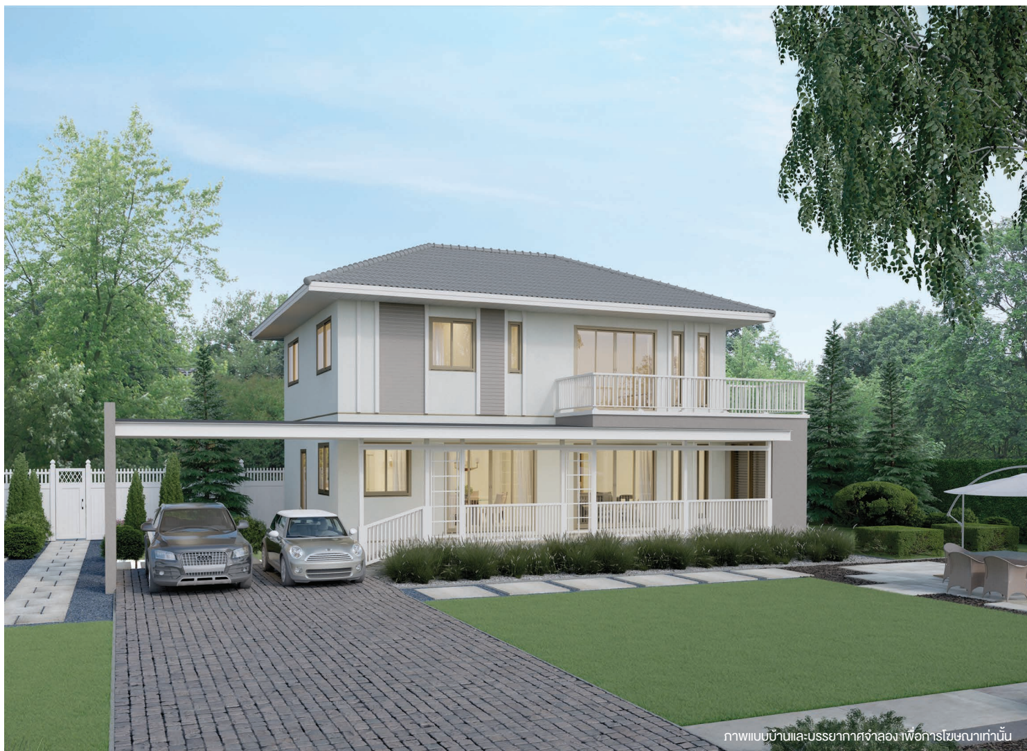
ภาพแบบบ้านและบรรยากาศจำลอง เพื่อการโฆษณาเท่านั้น

3 ห้องนอน 4 ห้องน้ำ ห้องรับแขก ห้องรับประทานอาหาร ห้องครัวไทย ห้องเตรียมอาหาร ห้องทำงาน และส่วนซักล้าง