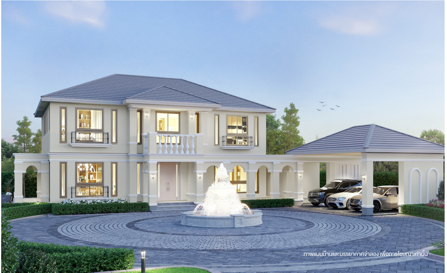
ภาพแบบบ้านและบรรยากาศจำลอง เพื่อการโฆษณาเท่านั้น

บ้าน 2 ชั้น สไตล์ NEO-CLASSIC เอกลักษณ์สำหรับผู้มีศิลปะอย่างแท้จริง โดดเด่นด้วยงานคลาสสิก ที่ผสมความทันสมัย ตกแต่งด้วยบัวและผนังภายนอกสีขาว ทำให้บ้านดูสง่างามและหรูหรายิ่งขึ้น เพิ่มพื้นที่ห้องทำงาน ประชุม หรือเป็นห้องเอนกประสงค์ที่สามารถปรับเปลี่ยนได้ตามต้องการ เชื่อมต่อกับระเบียงพักผ่อนส่วนตัว โดดเด่นด้วย Double volume ที่โถงทางเข้าขนาดใหญ่ ทำให้ภายในดูโอโถง โปร่งสบายยิ่งขึ้น และเพิ่มความเป็นส่วนตัวด้วย Family room ชั้น 2