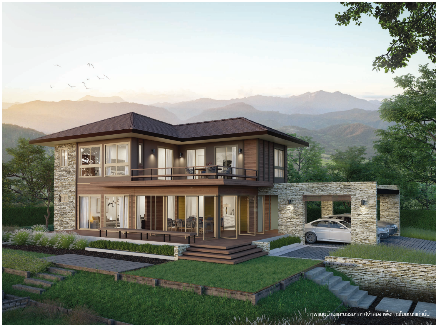
ภาพแบบบ้านและบรรยากาศจำลอง เพื่อการโฆษณาเท่านั้น

บ้านสไตล์ Resort ออกแบบโดยเลือกใช้วัสดุให้กลมกลืนกับธรรมชาติ สร้างความรู้สึกผ่อนคลาย ด้วยการเลือกใช้ไม้และหินตกแต่งภายนอก โดดเด่นด้วยระเบียงขนาดใหญ่ทั้ง 2 ชั้น เหมาะอย่างยิ่งสำหรับใช้เป็นพื้นที่ทำกิจกรรมร่วมกันในครอบครัวเพื่อให้ใกล้ชิดกับธรรมชาติมากยิ่งขึ้น ประตูและผนังกระจกบานใหญ่ ช่วยเปิดมุมมองให้เห็นทัศนียภาพที่งดงามรอบตัวบ้าน รวมถึงฟังก์ชันภายในบ้านที่จัดวางไว้อย่างลงตัว