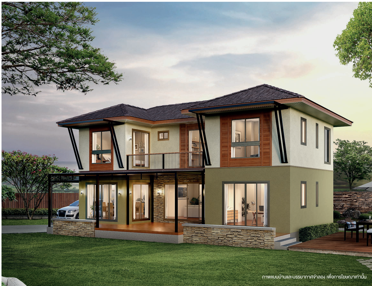
ภาพแบบบ้านและบรรยากาศจำลอง เพื่อการโฆษณาเท่านั้น

บ้าน 2 ชั้น ให้ความรู้สึกอบอุ่นด้วยธรรมชาติ โดยเลือกใช้วัสดุให้กลมกลืนกับสภาพแวดล้อม ให้ผู้อยู่อาศัยเหมือนกำลังพักผ่อนที่บ้านตากอากาศ ทุก ๆ พื้นที่ใช้สอยเชื่อมกับชานหน้าบ้านขนาดใหญ่ สามารถรับวิวและลมได้เต็มที่ ห้องนอนทุกห้องออกแบบให้เชื่อมกับระเบียงขนาดใหญ่ เป็นพื้นที่ส่วนตัวสำหรับคนในครอบครัว