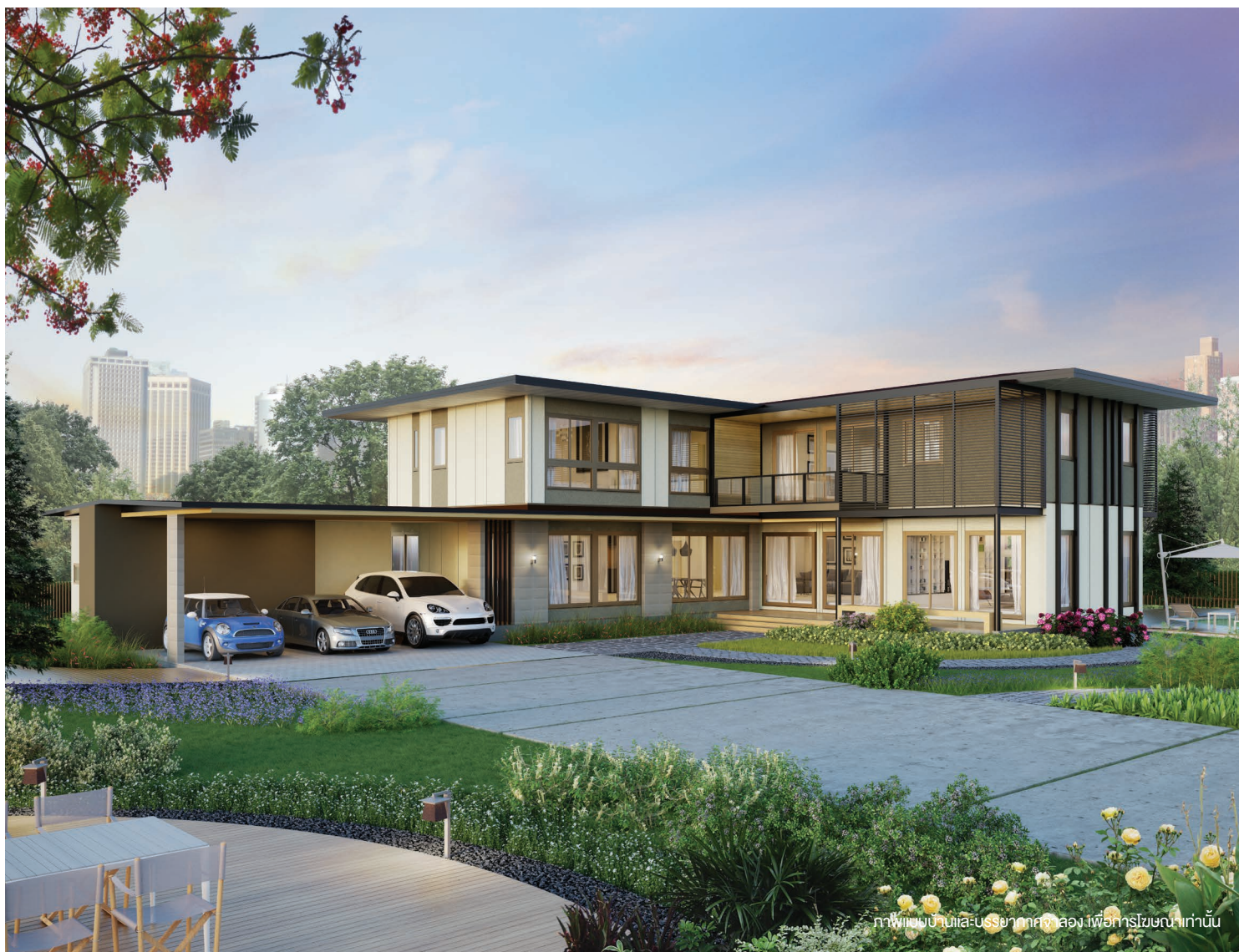
ภาพนี้เป็นศิลปะ-3D ที่สร้างขึ้นเพื่อใช้ในการโฆษณาเท่านั้น

ดีไซน์ MODERN เรียบง่าย เน้นเส้นสายที่คมชัด โดดเด่นด้วยการกำหนดพื้นที่ใช้สอยให้เกิดชั้นกึ่งแนวตั้งและแนวนอนของที่ดิน จึงสามารถเชื่อมต่อวิถีได้รอบบ้าน ภายในประกอบด้วยห้องนอนพร้อมห้องน้ำในตัวทุกห้อง รองรับทุกไลฟ์สไตล์ของทุกสมาชิกได้อย่างลงตัว