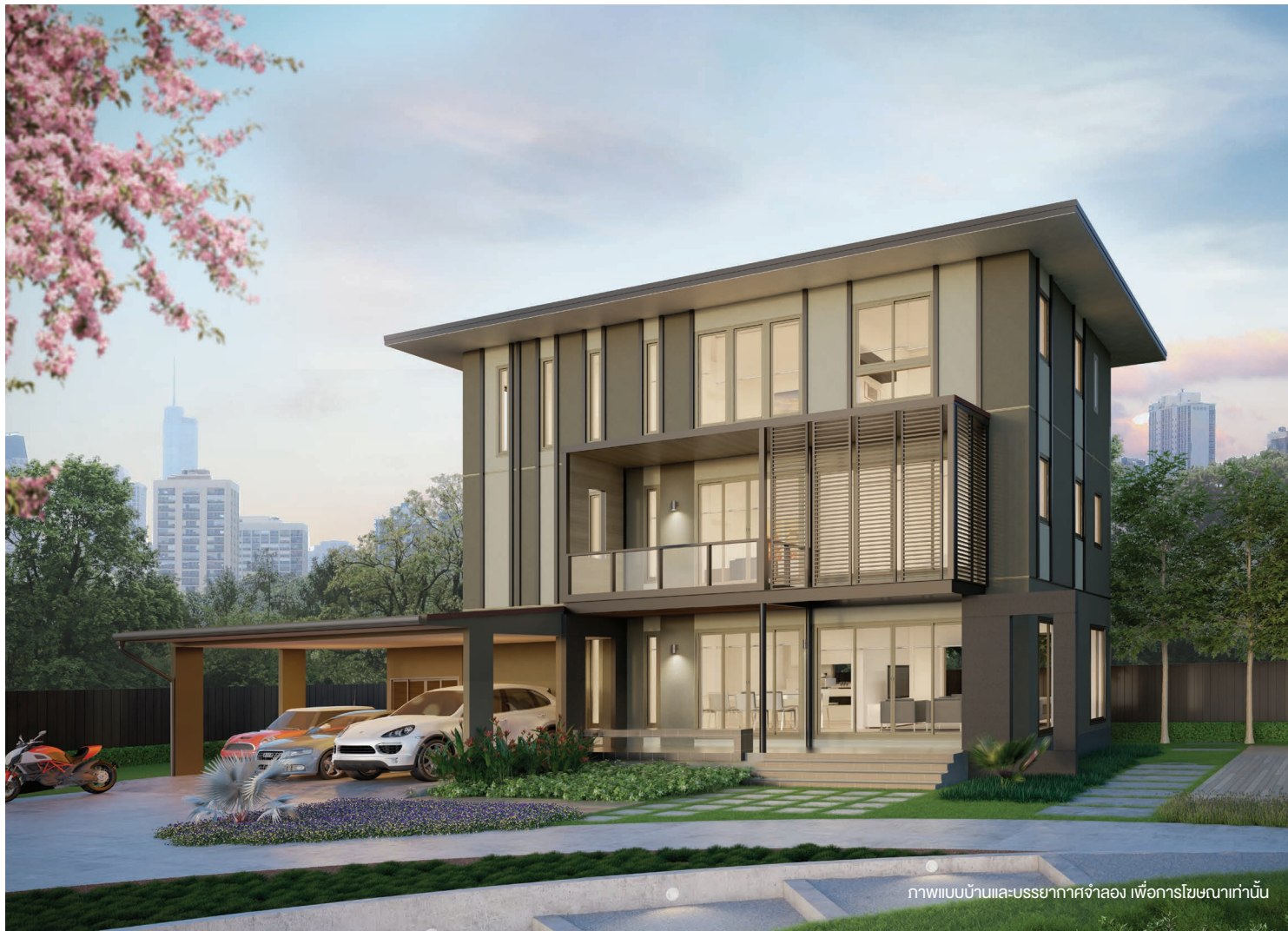
ภาพแบบบ้านและบรรยากาศจำลอง เพื่อการโฆษณาเท่านั้น

บ้านสไตล์ MODERN 3 ชั้น รูปทรงที่เรียบง่ายผสมผสานกับการจัดวางสีและวัสดุที่ลงตัว สร้างคาแรคเตอร์ เรียบ ก้นสมัย สำหรับผู้บริหารรุ่นใหม่ ชั้น 1 จัดพื้นที่แบบเปิดโล่งพร้อมทั้งหน้าต่างขนาดใหญ่ ให้ความรู้สึกเชื่อมต่อกับสวนรอบบ้านมากขึ้น ชั้น 2 - 3 จัดห้องนอนและห้องต่าง ๆ เป็นสัดส่วน สามารถให้ความรู้สึกเชื่อมต่อกันได้ จากห้องครอบครัวชั้น 2 ที่เชื่อมต่อกับระเบียงภายนอก