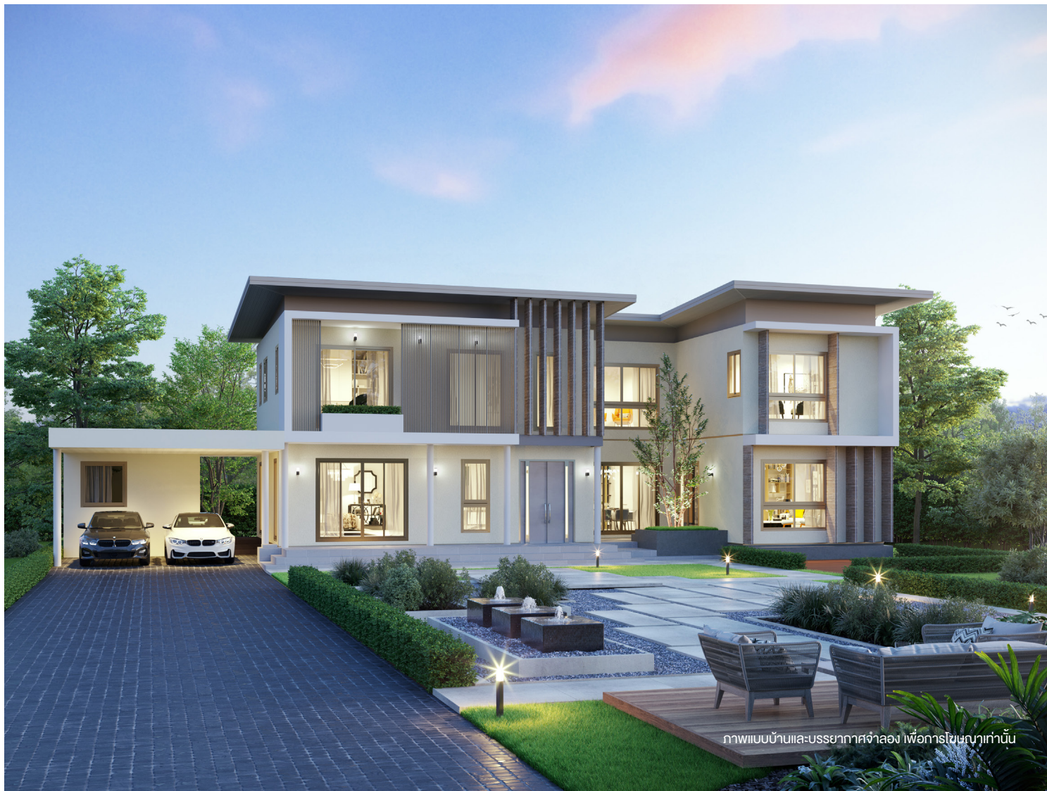
ภาพแบบบ้านและบรรยากาศจำลอง เพื่อการโฆษณาเท่านั้น

บ้าน 2 ชั้น สไตล์ MODERN สำหรับครอบครัวขนาดกลาง โดดเด่นด้วยการออกแบบบ้านให้เรียบหรู กั้นสมัย ด้วยโทนสี ivory และระแนง Façade อลูมิเนียมแนวตั้งสีทองแซมเป็ญ พื้นที่ส่วนกลางในบ้านชั้น 1 ห้องนั่งเล่นภายในบ้านมีขนาดใหญ่เชื่อมต่อกับพื้นที่ Semi-outdoor เปิดมุมมองรับสวนสวย และรองรับกิจกรรมต่างๆ ร่วมกันภายในครอบครัว พื้นที่ภายในชั้น 2 เพิ่มความพิเศษด้วยห้องนอนใหญ่มีระเบียงเชื่อมต่อกับ Family room ชั้น 2 ขยายพื้นที่ความสุข มุมพักผ่อนส่วนตัว และสะดวกสบายยิ่งขึ้น