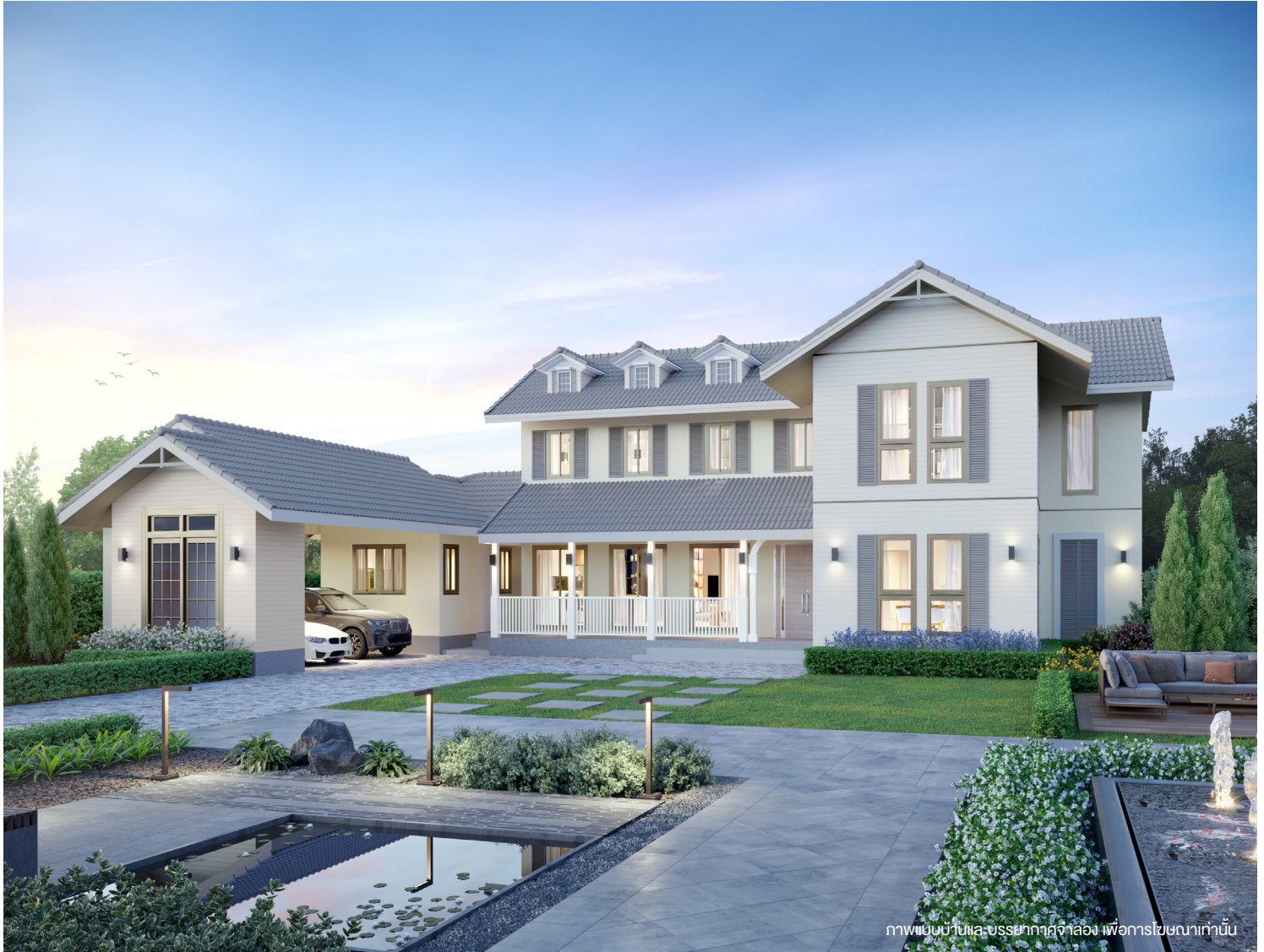
ภาพเขียนบ้านและบรรยากาศจำลอง เพื่อการโฆษณาเท่านั้น

บ้าน 2 ชั้น สไตล์ AMERICAN COTTAGE สำหรับครอบครัวขนาดกลาง เน้นการออกแบบให้กลมกลืนกับธรรมชาติ อบอุ่นและผ่อนคลายในสไตล์คอตเทจ มีระเบียงหน้าบ้านเพื่อเป็นมุมพักผ่อน จัดพื้นที่ส่วนพักผ่อนแบบ Open-plan พร้อมโถงสูงในบ้านขนาด 6 เมตร ช่วยให้ดูโปร่ง โล่งสบายยิ่งขึ้น เพิ่มห้องทำงาน ใช้ประชุม หรือปรับเปลี่ยนได้ตามต้องการ ห้องนอนใหญ่มาพร้อมโซฟาแต่งตัวขนาดใหญ่ มีห้องนอนผู้สูงวัยอยู่ชั้นล่าง