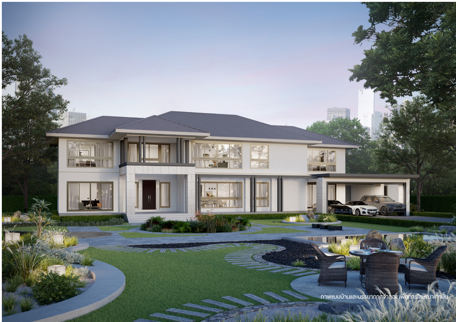
ภาพแบบบ้านและบรรยากาศจำลอง เพื่อการโฆษณาเท่านั้น

บ้าน 2 ชั้น สไตล์ CONTEMPORARY สำหรับครอบครัวขนาดใหญ่ ออกแบบบ้านให้งามสง่า เรียบหรู ด้วยโทนสีเทา เพิ่มความโดดเด่นด้วยกระเบื้องลายหินอ่อนที่เสาต้นหน้า พร้อมโถงทางเข้าบ้าน สูงโปร่ง ดูภูมิฐาน พื้นที่ภายในส่วนกลางชั้นล่างออกแบบให้เชื่อมต่อกัน ทุกห้องจัดวางพื้นที่ใช้สอยเป็นสัดส่วน ภายในบ้านมีฟังก์ชันห้องทำงานหรือใช้ประชุมได้ เพิ่มความเป็นส่วนตัวและสะดวกยิ่งขึ้นด้วย Family room ชั้น 2 และห้องนอนใหญ่ มีความพิเศษโดยเฉพาะโซนแต่งตัวและห้องน้้างขนาดใหญ่