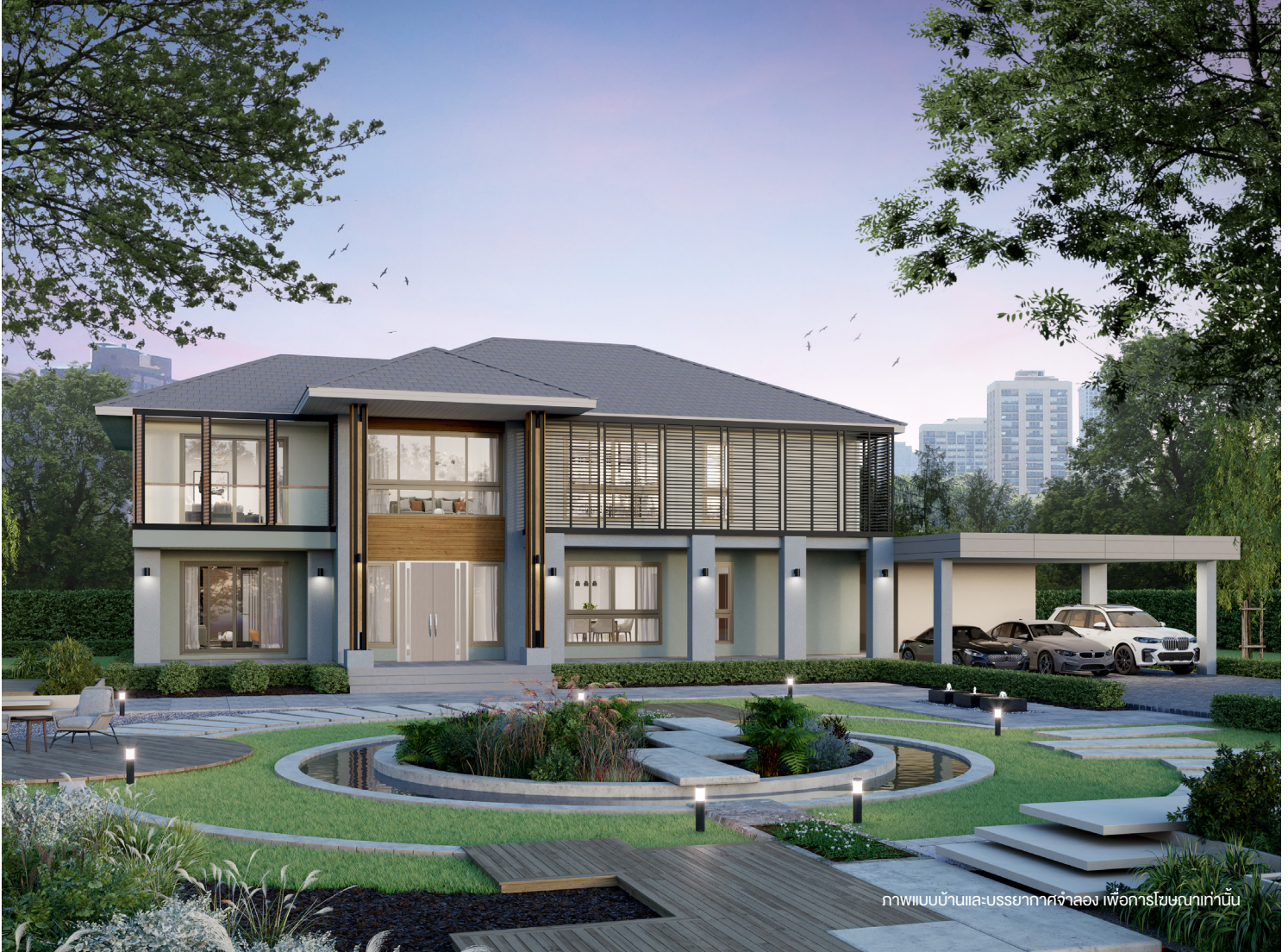
ภาพแบบบ้านและบรรยากาศจำลอง เพื่อการโฆษณาเท่านั้น

บ้าน 2 ชั้น สไตล์ CONTEMPORARY สำหรับครอบครัวขนาดกลาง โดดเด่นด้วยการเลือกใช้ ด้วยระแนง Façade อลูมิเนียมตกแต่งภายนอก พร้อมโรงทางเข้าบ้านขนาดใหญ่ สูงโปร่ง ภูมิฐาน พื้นที่ภายในส่วนกลางขนาดใหญ่ออกแบบให้เชื่อมต่อกัน ทุกห้องจัดวางพื้นที่ใช้สอยเป็นสัดส่วน ครบครันการใช้งาน เพิ่มฟังก์ชันห้องทำงาน ใช้ประชุม หรือเป็นห้องเอนกประสงค์ที่สามารถปรับฟังก์ชันได้ตามไลฟ์สไตล์ เพิ่มความเป็นส่วนตัวและสะดวกยิ่งขึ้นด้วย Family room ชั้น 2 ห้องนอนใหญ่ที่มาพร้อมระเบียงนั่งเล่นส่วนตัว