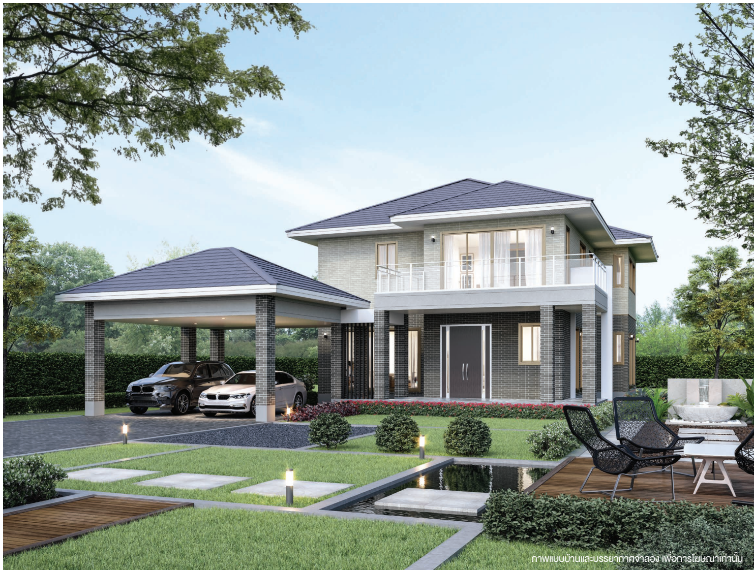
ภาพแบบบ้านแอส-บรียากาศจำลอง เพื่อการโฆษณาเท่านั้น

บ้าน 2 ชั้นสไตล์ Signature แบบฉบับ ULTIMATE Series ออกแบบใหม่ด้วยแนวคิดหน้าแคบ ลงตัวกับที่ดิน ทุกห้องจัดวางพื้นที่ใช้สอยเป็นสัดส่วน พร้อมส่วนกลางที่เชื่อมต่อถึงกัน เหมาะสำหรับการทำกิจกรรมร่วมกันของสมาชิกในครอบครัว