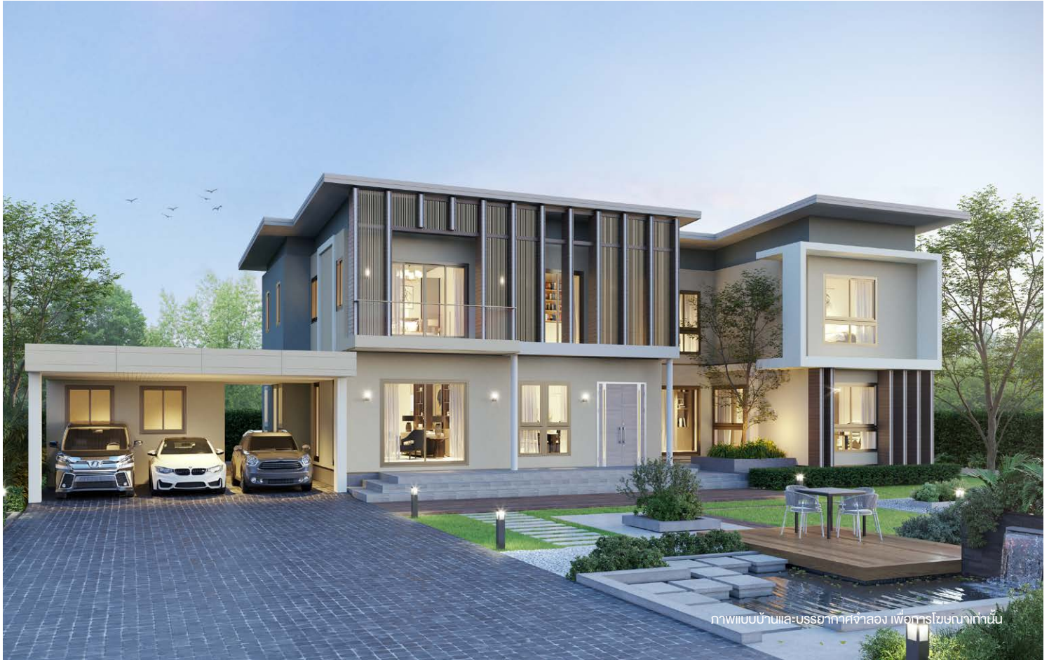
ภาพแบบบ้านและบรรยากาศจำลอง เพื่อการโฆษณาเท่านั้น

บ้าน 2 ชั้น สไตล์ MODERN NATURE โดดเด่นด้วยระแนง Façade อลูมิเนียมลายไม้ ให้ความเป็นส่วนตัว ออกแบบพื้นที่ใช้สอยครบครัน มีมุมนั่งพักผ่อนกลางบ้าน ให้ความรู้สึกผ่อนคลายอยู่ร่วมกับธรรมชาติ มาพร้อมโรงในบ้านขนาดใหญ่ Double space ทำให้ภายในโปร่ง โล่ง รู้สึกสบายพิเศษเพิ่มพื้นที่นั่งเล่นทำกิจกรรมชั้น 2 พร้อมทั้งระเบียงเชื่อมต่อภายนอก และ ห้องนอนใหญ่มีระเบียงไว้เป็นมุมนั่งพักผ่อนส่วนตัว