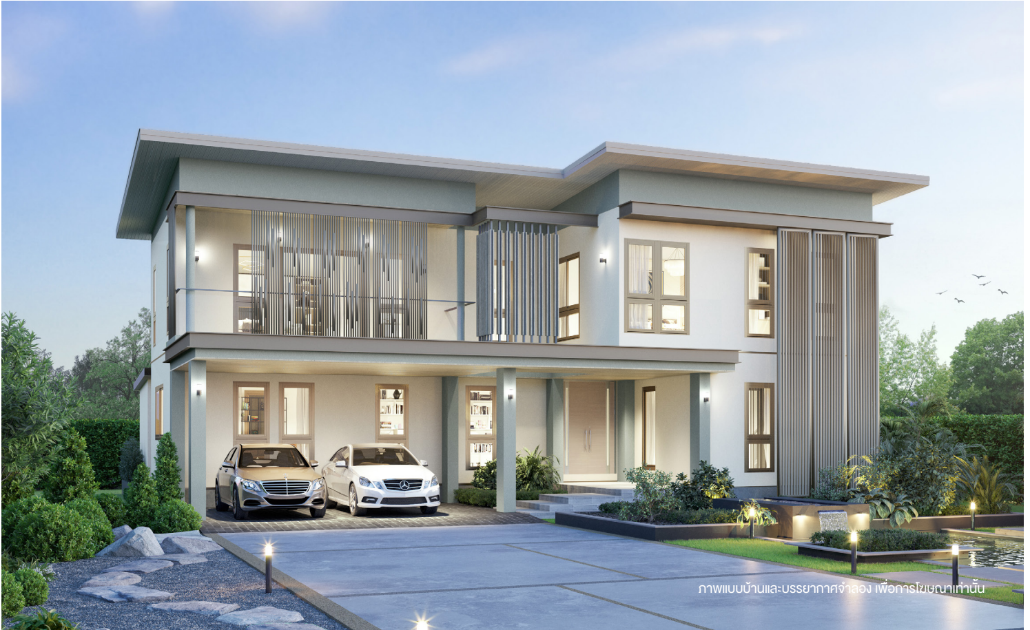
ภาพแบบบ้านและบรรยากาศจำลอง เพื่อการโฆษณาเท่านั้น

บ้าน 2 ชั้น สไตล์ MODERN โดดเด่นด้วยการออกแบบบ้านให้เรียบหรู ทันสมัย ด้วยโทนสี ivory และระแนง Façade อลูมิเนียมแนวตั้งสีทองแซมเปปเปอร์ จัดพื้นที่ส่วนกลางแบบ open plan เพื่อให้สมาชิกในครอบครัวมีกิจกรรมและใช้เวลาร่วมกัน พร้อม Double volume ขนาดใหญ่ในบ้าน เชื่อมบรรยากาศให้รู้สึกถึงความใกล้ชิดกันของสมาชิกในบ้าน เพิ่มความเป็นส่วนตัวยิ่งขึ้นด้วย Family room ชั้น 2 ห้องนอนใหญ่มีระเบียงไว้เป็นมุมพักผ่อนส่วนตัวได้ พร้อมทั้งจอดรถ 2 คัน