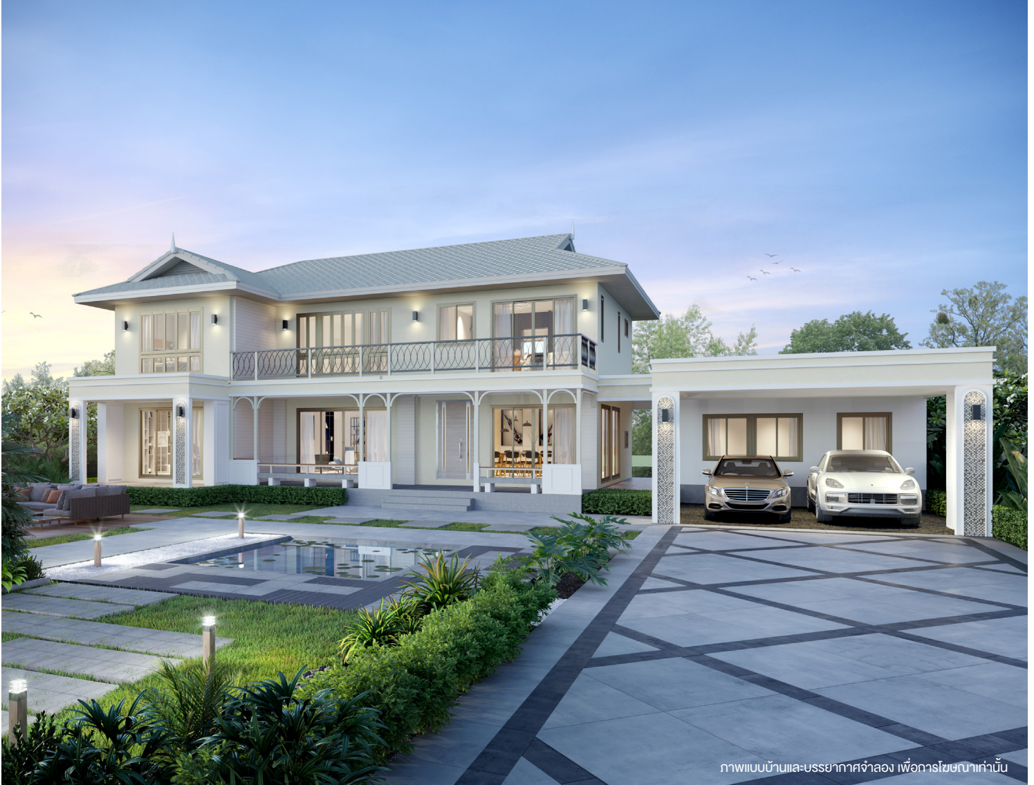
ภาพแบบบ้านและบรรยากาศจำลอง เพื่อการโฆษณาเท่านั้น

บ้าน 2 ชั้น สไตล์ ORIENTAL สำหรับครอบครัวขนาดกลาง โดดเด่นด้วยการออกแบบเชิงสถาปัตยกรรมภายนอกที่ดูอ่อนช้อย และแฝงไปด้วยความอบอุ่น จัดพื้นที่ส่วนพักผ่อนแบบ Open-plan เชื่อมต่อกับระเบียงหน้าบ้าน เป็นพื้นที่ที่ทุกคนในบ้านมาใช้เวลาร่วมกัน มีห้องทำงานเป็นสัดส่วนที่ชั้นล่างพร้อมระเบียงส่วนตัว เพิ่มความเป็นส่วนตัวยิ่งขึ้นด้วย Family room ชั้น 2 และห้องนอนใหญ่พร้อมระเบียงนั่งเล่นส่วนตัวชมทัศนียภาพได้เต็มที่ มีห้องนอนผู้สูงอายุอยู่ชั้นล่าง